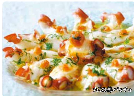
たこの梅パッチョ