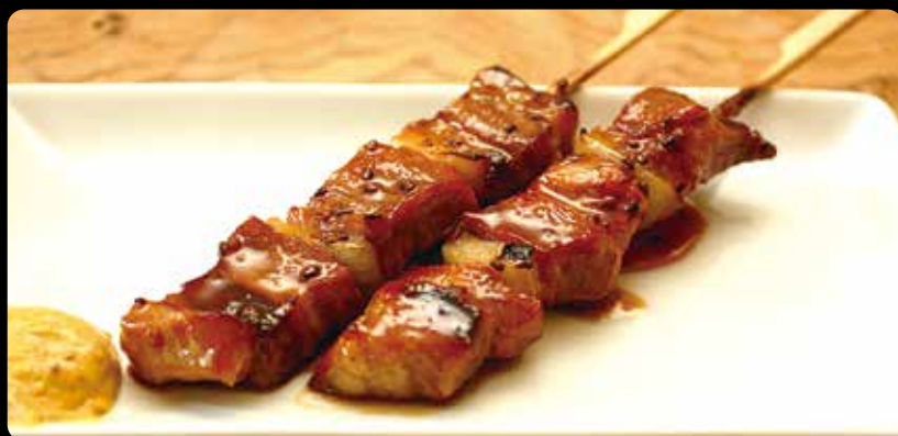
◆ 室蘭焼鳥(1本) 200円