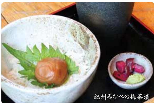
紀州みなべの梅茶漬