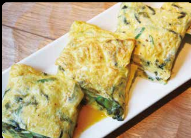
◆ 辛し高菜入り玉子焼 600円