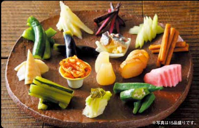
※写真は15品盛りです。